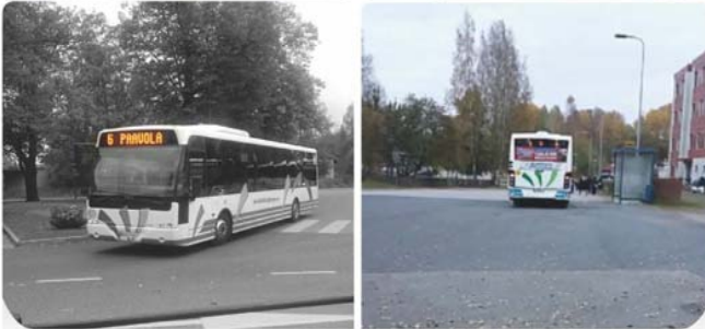
Kuvat ovat syksyn valokuvakilpailun satoa. Kuvaajina Julia Pislä ja Carl Reimets.